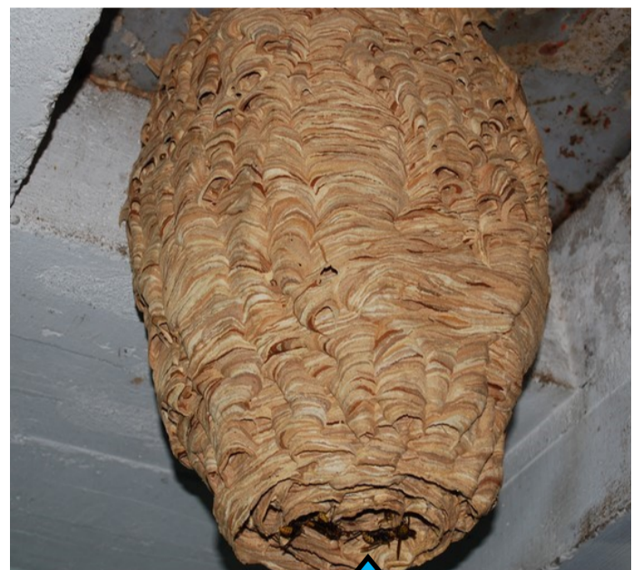
Trou d'entrée du nid au dessous

N'y touchez pas, prenez des photos PREVENEZ LA MAIRIE